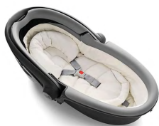
Автокресло «люлька» группы 0 для детей массой менее 10 кг

Детские удерживающие устройства подразделяют на 5 весовых групп: