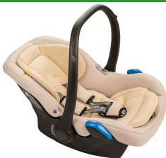
Автокресло группы 0+ для детей массой менее 13 кг