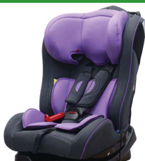
Автокресло группы II для детей массой 15-25 кг