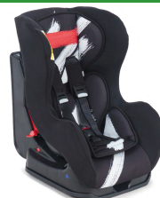
Автокресло группы I для детей массой 9-18 кг