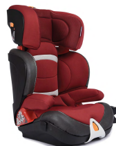
Автокресло группы III для детей массой 22-36 кг (возможно использование бустера)